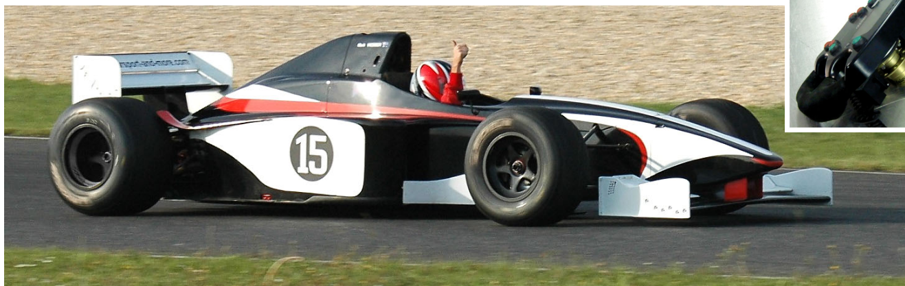
WIPP-Schaltung am Lenkrad

Erleben Sie auch im Lola Formel 3000 wahre Beschleunigungsorgien : Zoomen Sie sich in 5,6 sec. auf Tempo 200 km! Auch der Kurvengrip ist bereits fast auf Formel 1 Niveau: Riesige Flügel breite Rennsicks (sogar noch größere Reifen als im F1) sorgen dafür, daß es Sie in Kurven mit rund 3,5 „G“ an die Cockpitwand presst – ein faszinierendes Fahrgefühl zu einem reduzierten Einstiegspreis. → Farbprospekt und Kurstermine bitte bei uns anfordern / als PDF down-loaden.