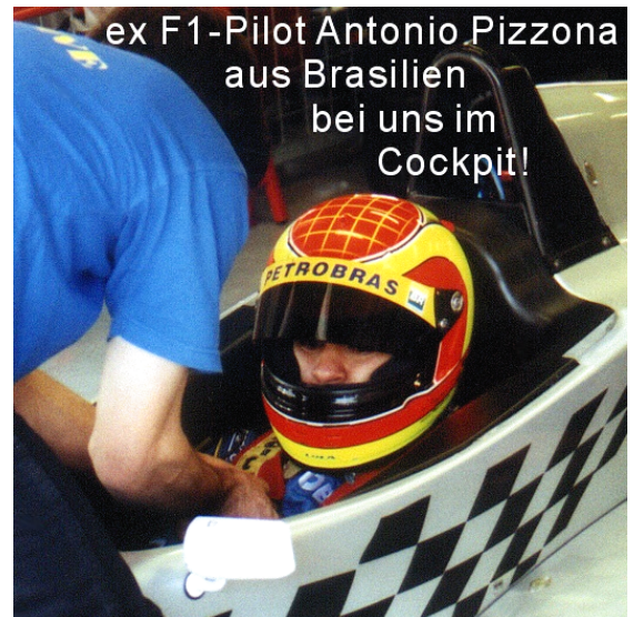
ex F1-Pilot Antonio Pizzonia aus Brasilien bei uns im Cockpit!

„Erfahren“ Sie diese pfeilschnellen Sportgeräte bei uns. Machen Sie jetzt Ihren Jugendtraum vom Formel Rennfahren wahr!